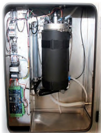
Fig 1 – IP54 kapslingsdimension